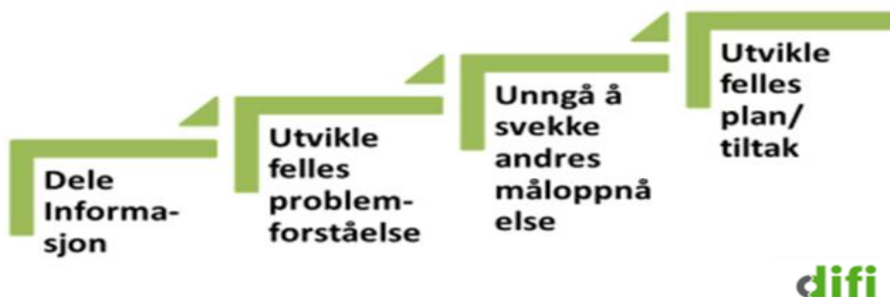
Figur 1: «Samordningsstigen» («Mot alle odds? Veier til samordning i norsk forvaltning», Difi 2014)

Innsatsen i 2015 med å forankre en felles forståelse av perspektivene i Bolig for velferd gjør at direktoratene nå står bedre rustet til å iverksette felles tiltak. Den etablerte samarbeidsstrukturen i strategien bygger videre på strukturen omtalt i tiltaksplanen for 2015: