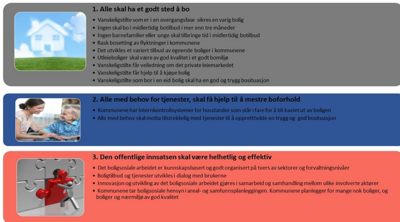
Figur 4: Strategiens 15 målsetninger

Direktoratene har et aktivt forhold til de 15 målsetningene og anvender dem i arbeidet med strategien. Særlig blir målsetningene sett i sammenheng med Nasjonalt prosjekt for bedre styringsinformasjon og fremtidig kunnskap om status og måloppnåelse i Bolig for velferd.