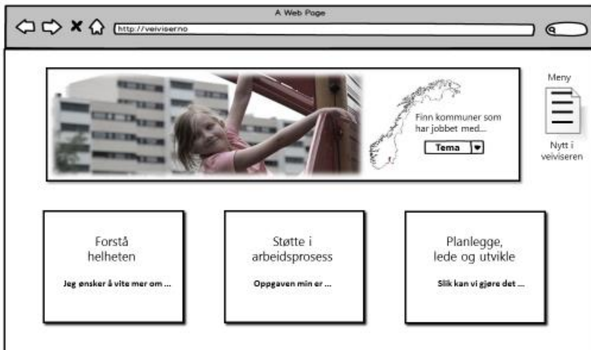
Figur 3: Illustrasjon av forsiden til Veiviser Bolig for velferd

Teknisk plattform er valgt, og visuell profil for Veiviseren er snart ferdig utarbeidet. Avrop på konsulenttjenester over rammeavtalene til Husbanken ble sendt ut i mars 2016, og oppstart av utviklingsarbeidet er planlagt i april 2016. Den tekniske løsningen for innsamling av tekst og dokumentasjon, pre-publiseringsdatabasen, er under ferdigstilling. Utviklingen av pre-publiseringsdatabasen er imidlertid forsinket med ca. halvannen måned, hvilket skaper noen utfordringer knyttet til forventningene til innholdsproduksjonen og reduserer framdriften. De ansvarlige for produksjonen av det faglige innholdet har fått word-maler de skal benytte frem til pre-publiseringsløsningen er på plass og er dermed ikke forhindret fra å gjøre sine oppgaver. Utover pre-publiseringsdatabasen er det ingen avvik fra fremdriftsplanen for Veiviser Bolig for velferd. Første versjon av Veiviseren skal lanseres i løpet av 2016.